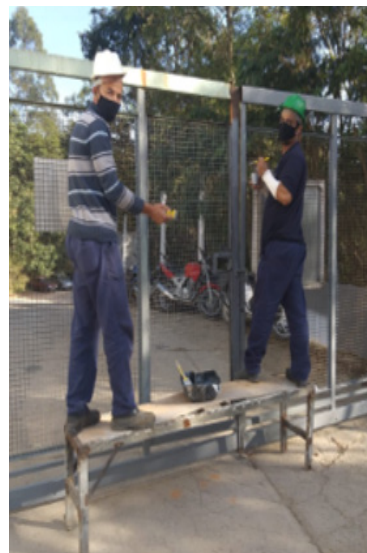
Portão do G3 depois da reforma