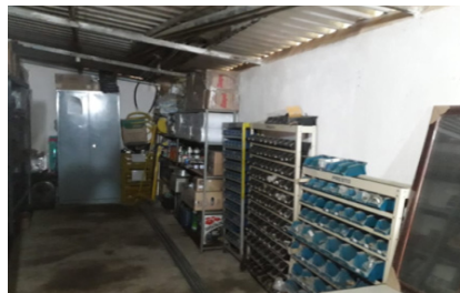
Organização do almoxarifado

A equipe da extrusão e de PCP tem realizado vários trabalhos de melhoria no ambiente da empresa. Alguns em andamento e outros já finalizados: